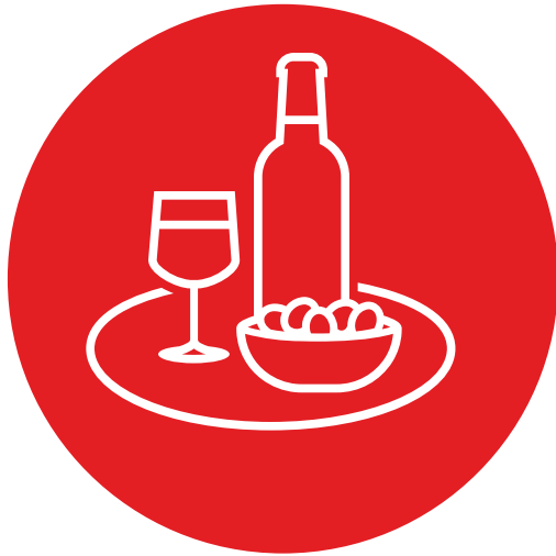
Τρόφιμα και Ποτά